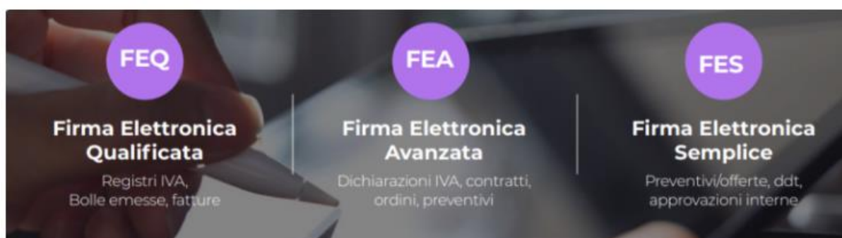
AgileSign supporta tre tipi di forma elettronica: la firma elettronica qualificata, quella avanzata e quella semplice

Nel processo di digitalizzazione delle imprese, la firma elettronica gioca un ruolo fondamentale: sblocca, infatti, il processo di autenticazione, un passaggio fondamentale per dare seguito agli iter operativi digitalizzati. Ecco, quindi, AgileSign, la piattaforma multicanale di firma elettronica che prevede strumenti diversificati per approvare o firmare o completare un documento.